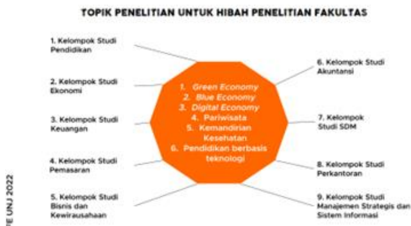
Gambar 1 Topik Penelitian untuk Hibah Penelitian Fakultas

FE UNJ memiliki SDM yang berasal dari bidang ilmu berbeda-beda. Namun demikian dalam menjalankan kegiatan Tridarma Perguruan Tinggi tentunya harus senantiasa memperhatikan bidang ilmunya masing-masing. Oleh karena itu, dalam kegiatan penelitian khususnya, FE UNJ melakukan pemetaan terhadap bidang ilmu masing-masing dosen pada semua program studi yang ada. Berikut ini hasil pemetaan bidang ilmu yang terdiri dari Akuntansi, Manajemen, Pendidikan, Ekonomi, Kewirausahaan dan Keuangan. Selanjutnya, setiap dosen memiliki research interest yang beragam dan dikelompokkan dalam topik penelitian seperti yang disajikan pada Gambar 1.