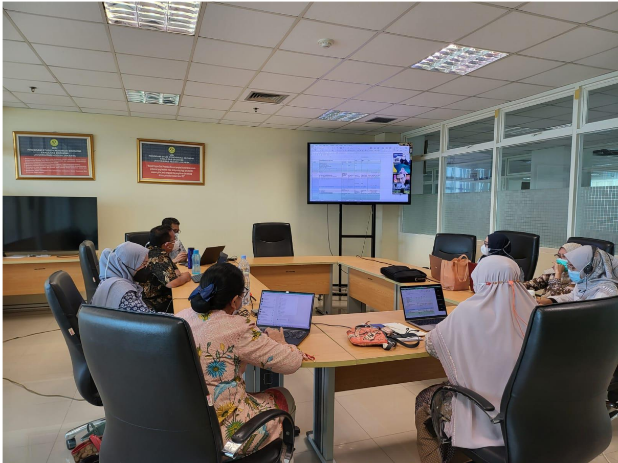
PHOTO KEGIATAN PELAKSANAAN RAPAT